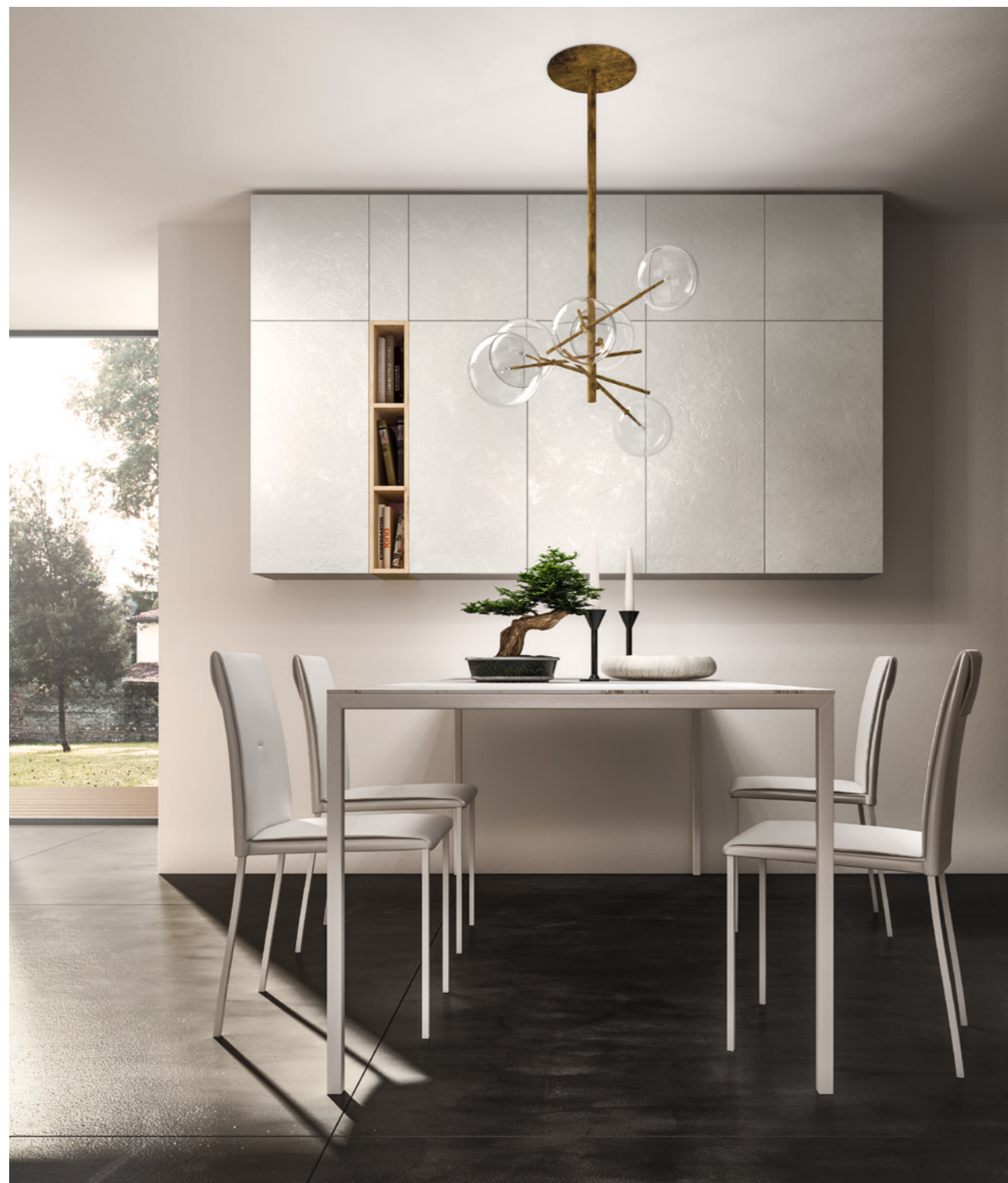
Tavolo minimal bianco con sovrapiano in Stone Calacatta sp. 1,2 cm. sedie Gaia con cuscino ecopelle bianca. Minimal Bianco table with over top unit in 1.2cm thick Stone Calacatta, Gaia chair with white ecoleather cushion. Table minimal Bianco avec sur-plan en Stone Calacatta sp. 1,2 cm. chaise Gaia avec coussin écocuier blanc.