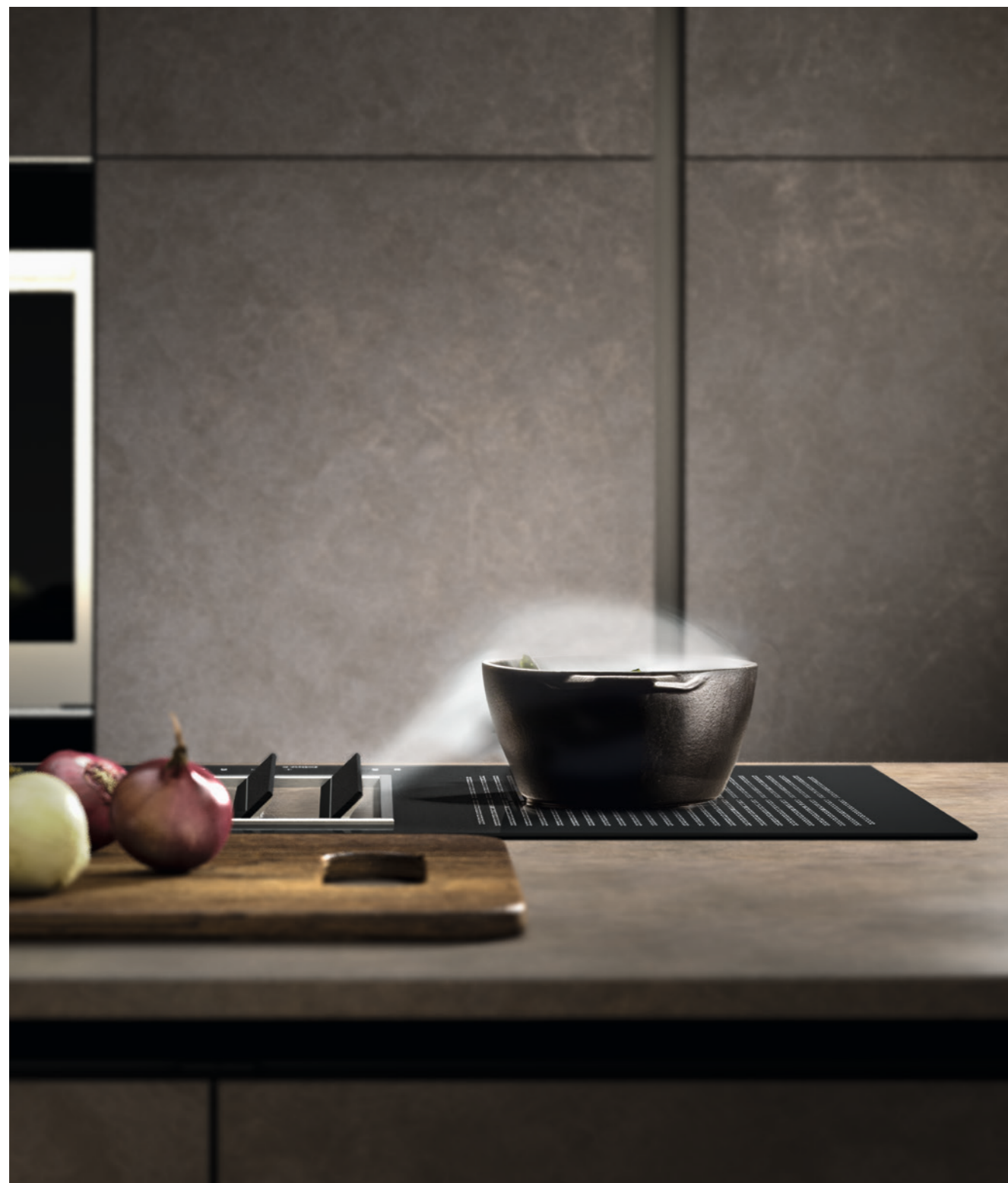
Piano cottura induzione da 88 cm. Quantum di Falmec con aspirazione integrata. 88 cm wide Quantum by Falmec induction hob with integrated suction. Plan de cuisson à induction de 88 cm. Quantum de Falmec avec aspiration intégrée.