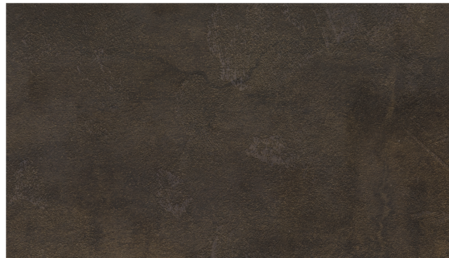
Ossido scuro FB49