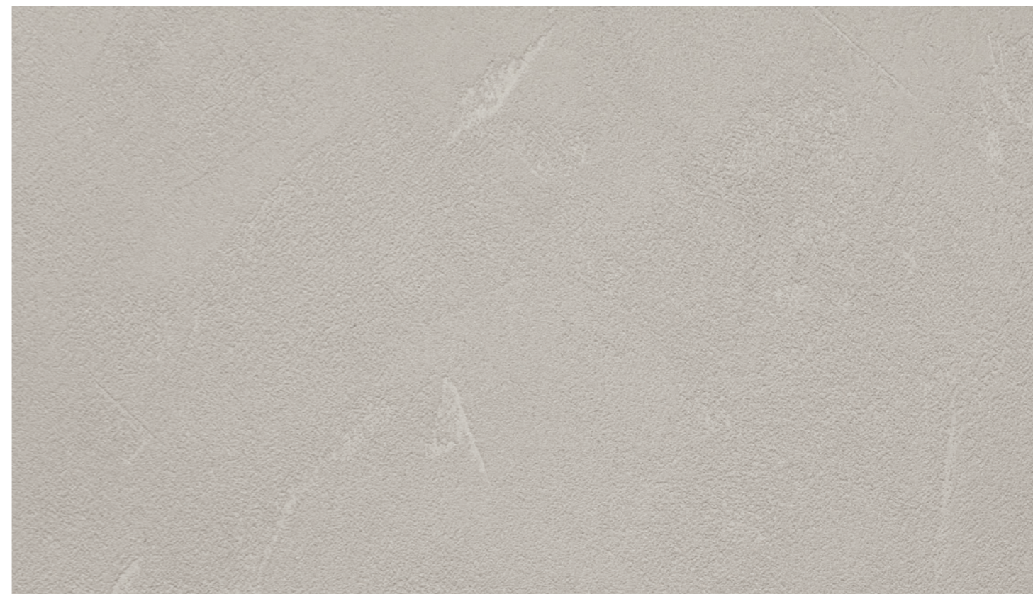
Ecomalta beton FB53