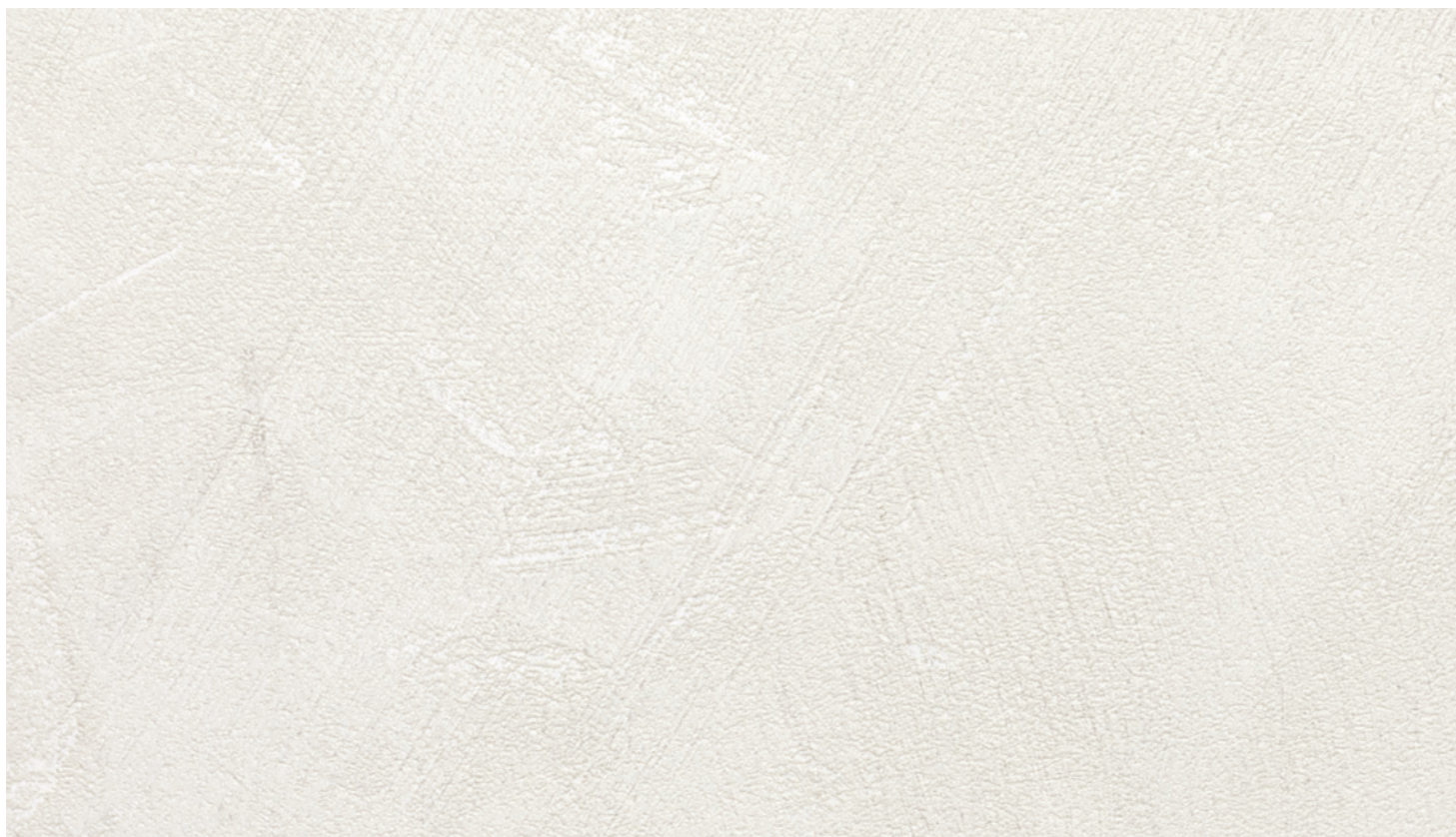
Ecomalta bianco FB50