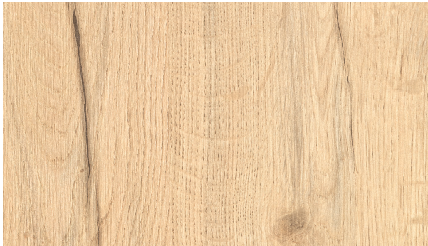
Rovere Vintage Naturale LR33