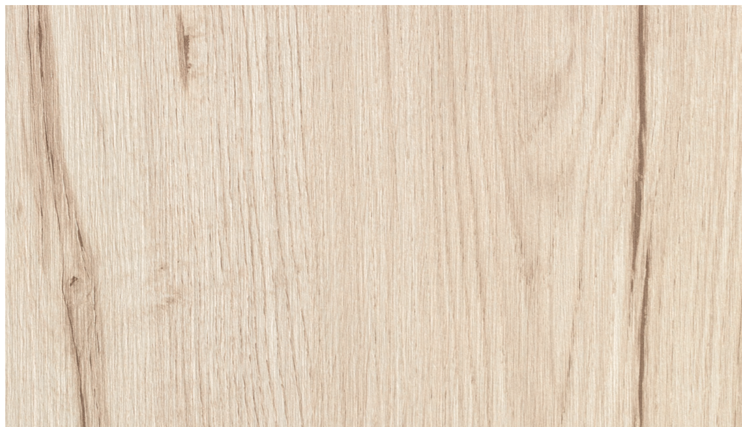
Rovere Vintage Bianco S153