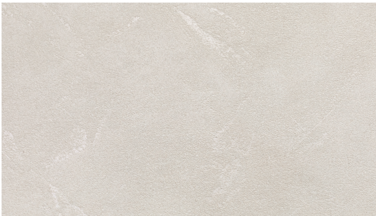
Ecomalta muro FB45